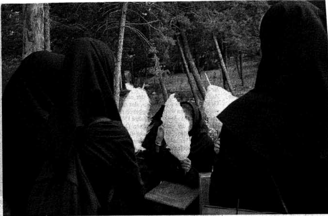
•StudentInnen in den vorgeschriebenen Kleidern – mit schwarzem Mantel und Magna-e (Kapuze) – essen Zuckerwatte, Teheran, 2004.

Die Gesellschaft bewegt sich, doch der Gottesstaat steht einer Reformpolitik im Wege: «Iran. Stillstand oder Aufbruch». Die neue Ausstellung in der Fotogalerie Coalmine zeigt Dokumentar fotografien von Ulla Kimmig.